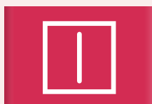
Drogen op een droogrek