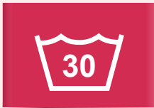
30 °C normale was