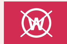
Niet nat reinigen