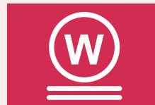
Zeer milde natte reiniging