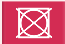
Niet in de droogkast drogen

Het vierkant is normaal gesproken het derde symbool op het waslabel en geeft aan hoe jouw kledingstuk kan worden gedroogd. De puntjes geven de stand van de droogkast aan en de streepjes de manier en de plaats van het drogen.