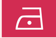
Niet heet strijken