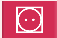
Normaal drogen in de droogkast