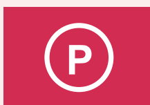
Behandeling met perchloorethyleen