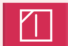
Op een droogrek in de schaduw drogen