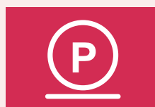
Voorzichtige behandeling met perchloorethyleen