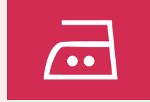
Bij matige hitte strijken