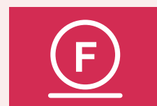
Voorzichtige behandeling met koolwaterstof