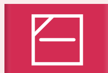
Liggend drogen in de schaduw