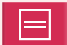
Kletsnat en liggend drogen