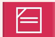
Kletsnat en liggend drogen in de schaduw